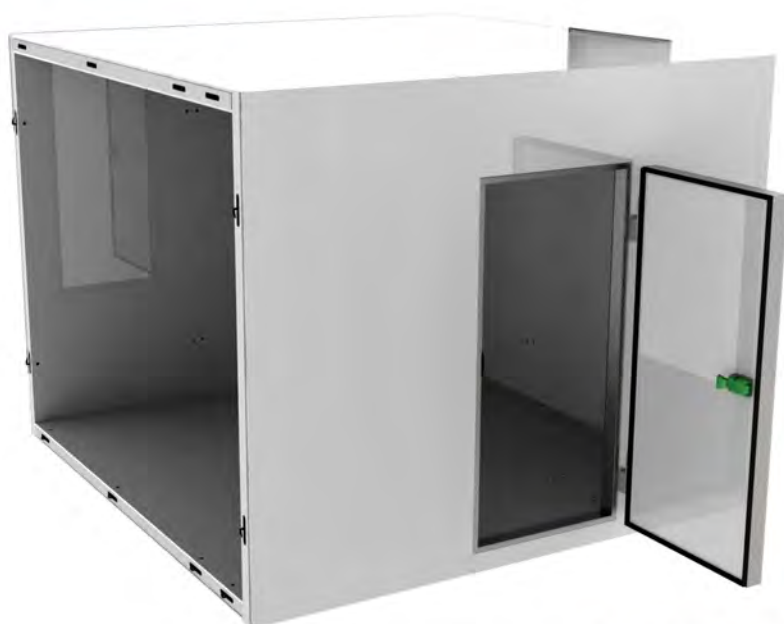
▲ Vista completa de la puerta