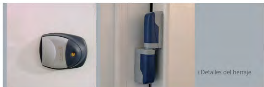
▼ Detalles del herraje